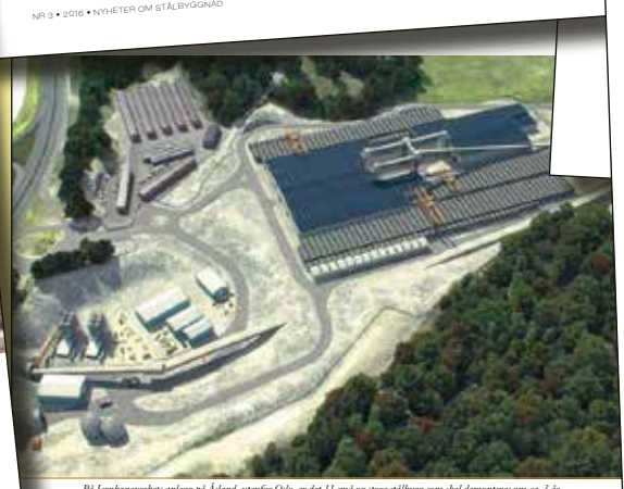
På Jernbaneverkets anlegg på Åsland, utenfor Oslo, er det 11 små og store stålløp som skal demonteres om ca. 3 år.

Bestillere: Akademiska hus Arkitekt: Christoffersen & Co Konstruktør: WSP Ståleentreprenør: Smederna Stålleger: Europrofil