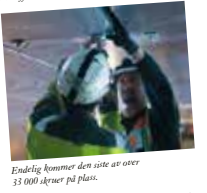
Endelig kommer den siste av over 33 000 skruer på plass. Endelig er alle de syv tusen platene over øsøpet, og de syv tusen platene på sidene på plass. Bildet er tatt sørøst i hallen.