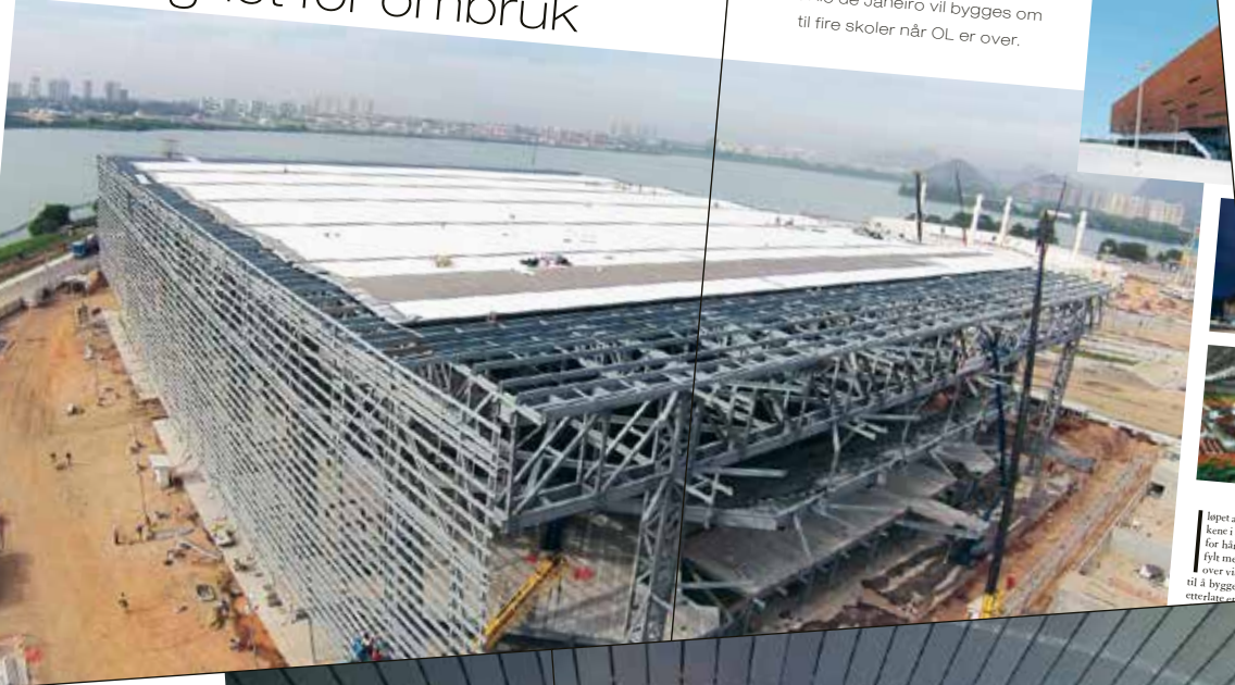
Øsøpet av de to arenaer i Rio vil for håndballfylt med 12 OL over vil anlegges til å bygge fire nye skoler.

tilkallingen og til pakken under. Alle som jobber på og tau. I forgrunnen: Arvo Nyberg fra ZND Nedcom. FAKTA Hovedentreprenør: HENT AS Entreprenør for borettslaget i Holmlia: Entreprenør for himlingsplatene og blikkenslagerarbeid: ZND Nedcom Materialer: - over 1000 tonn stål i taket - 3 km hovedbærestål (HEA 360) - 686 skreddersydd opphengeslag - totalt 8 333 plater - 11 400 kvadratmeter - 33 000 skruer til platene i taket